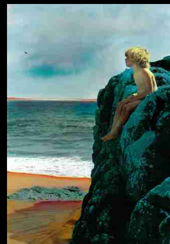
María es una duendecilla, 2003