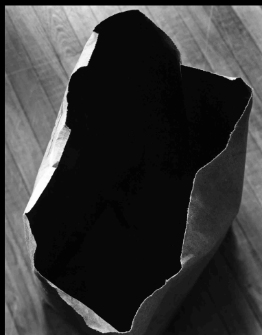
Bolsa de papel, 1992