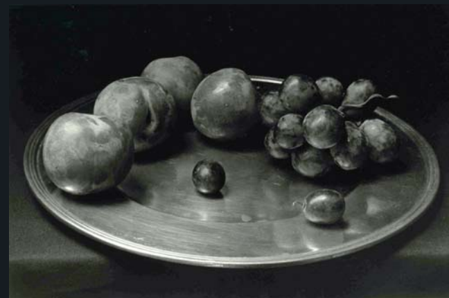
Bodegón con ciruelas y uvas, 2006

Entre sus muchas publicaciones cabe destacar Pilar Pequeño , Madrid: La Fábrica, Colección PhotoBolsillo nº 12; Fotografías. Pilar Pequeño , Madrid: Galería Cuatro Diecisiete; Pilar Pequeño , Sevilla: Caja San Fernando; Fotógrafos de Madrid Comunidad , Madrid: Biblioteca Nacional; 150 años de Fotografía Propuesta para una colección , Caja Madrid; Gabriel Cualladó , Principado de Asturias: Museo Antón. Candás; Cuatro Direcciones. Fotografía Contemporánea Española. 1970-1990 , Madrid: Lunwerg editores, S.A; Imágenes escogidas. La colección Gabriel Cualladó , Valencia: IVAM.