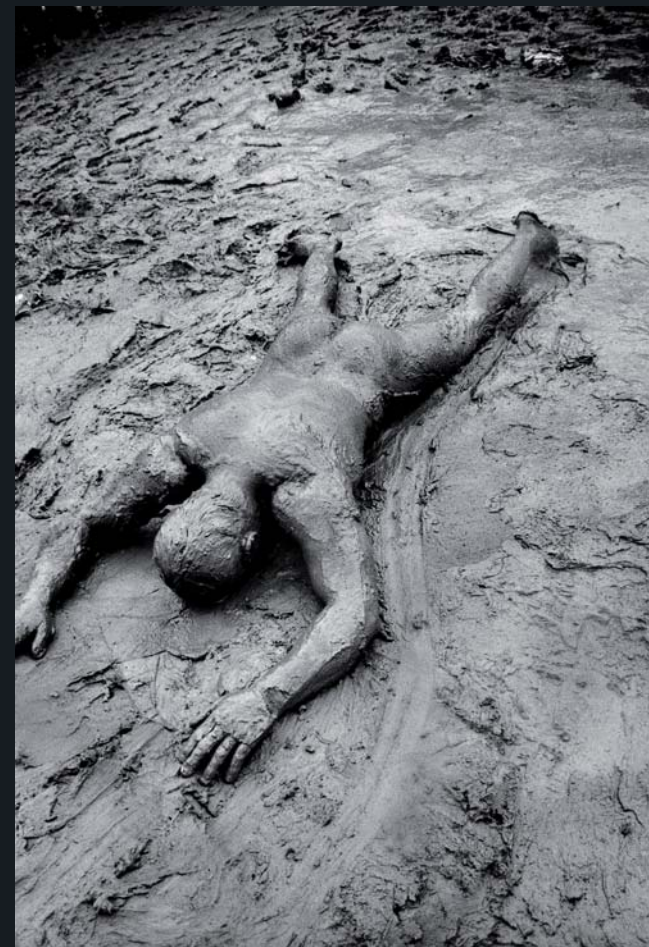
Festival Woodstock, 1994

En la actualidad trabaja como fotógrafo free-lance, dividiendo su actividad entre el retrato editorial, la publicidad y el reportaje.